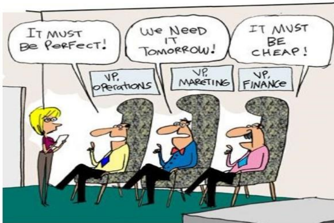
HOW TO TORTURE A BUSINESS ANALYST