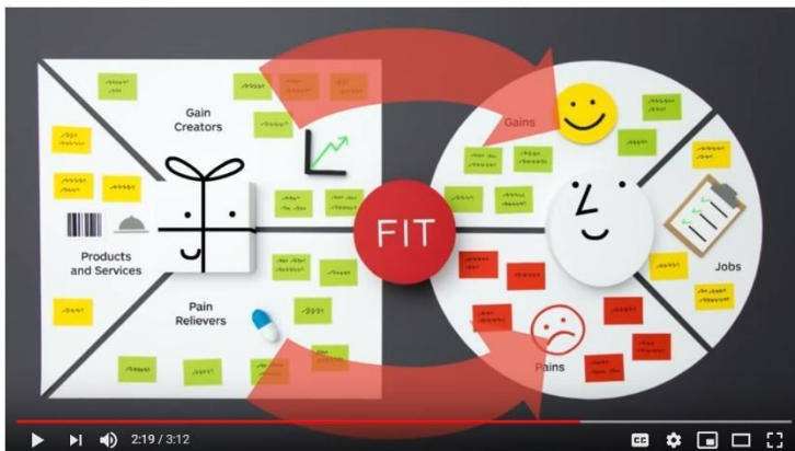
Stratgyzer's Value Proposition Canvas Explained

Osterwalder je v nadaljevanju Business Model Canvas ustvaril Values Proposition Canvas. Namesto pisne razlage o tem modelu, vas vabim, da si ogledate tale kratek filmček z zelo slikovito razlago.